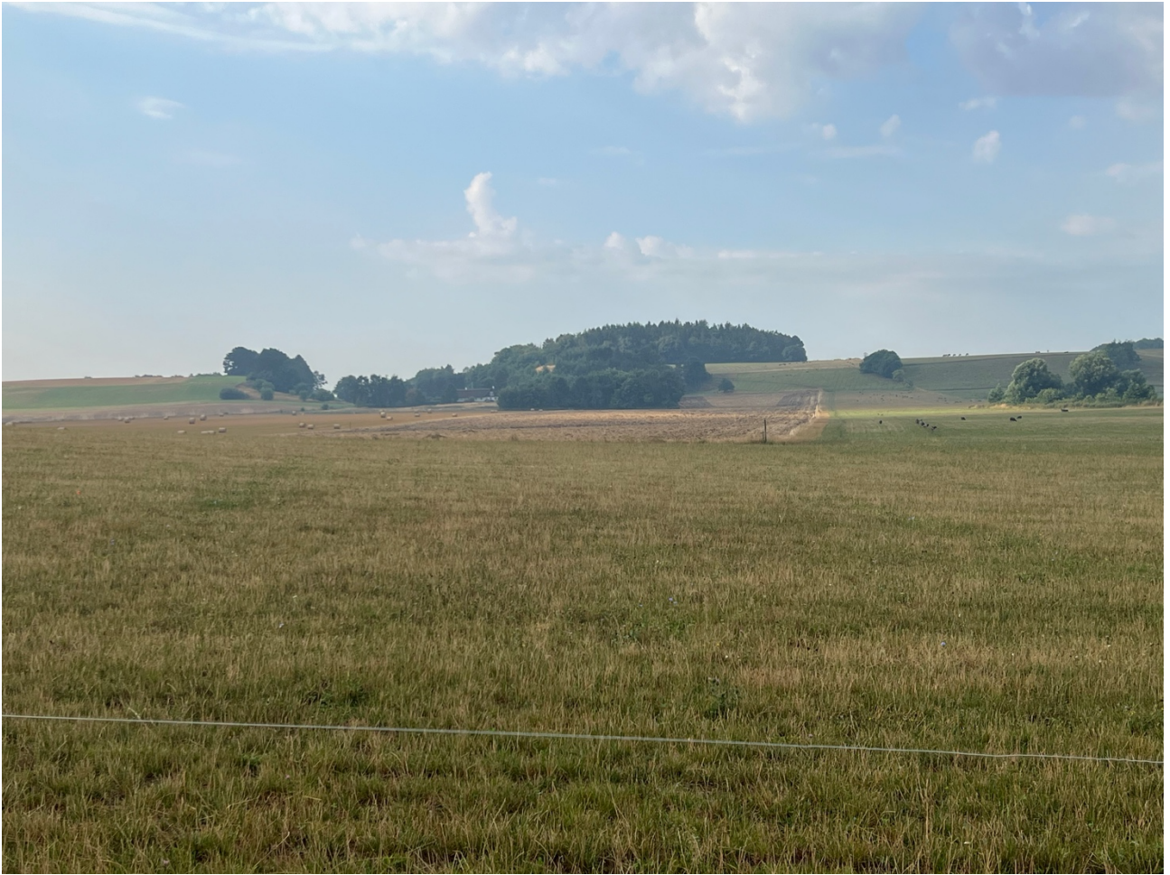
Bjerget og Skåret set fra Strø.