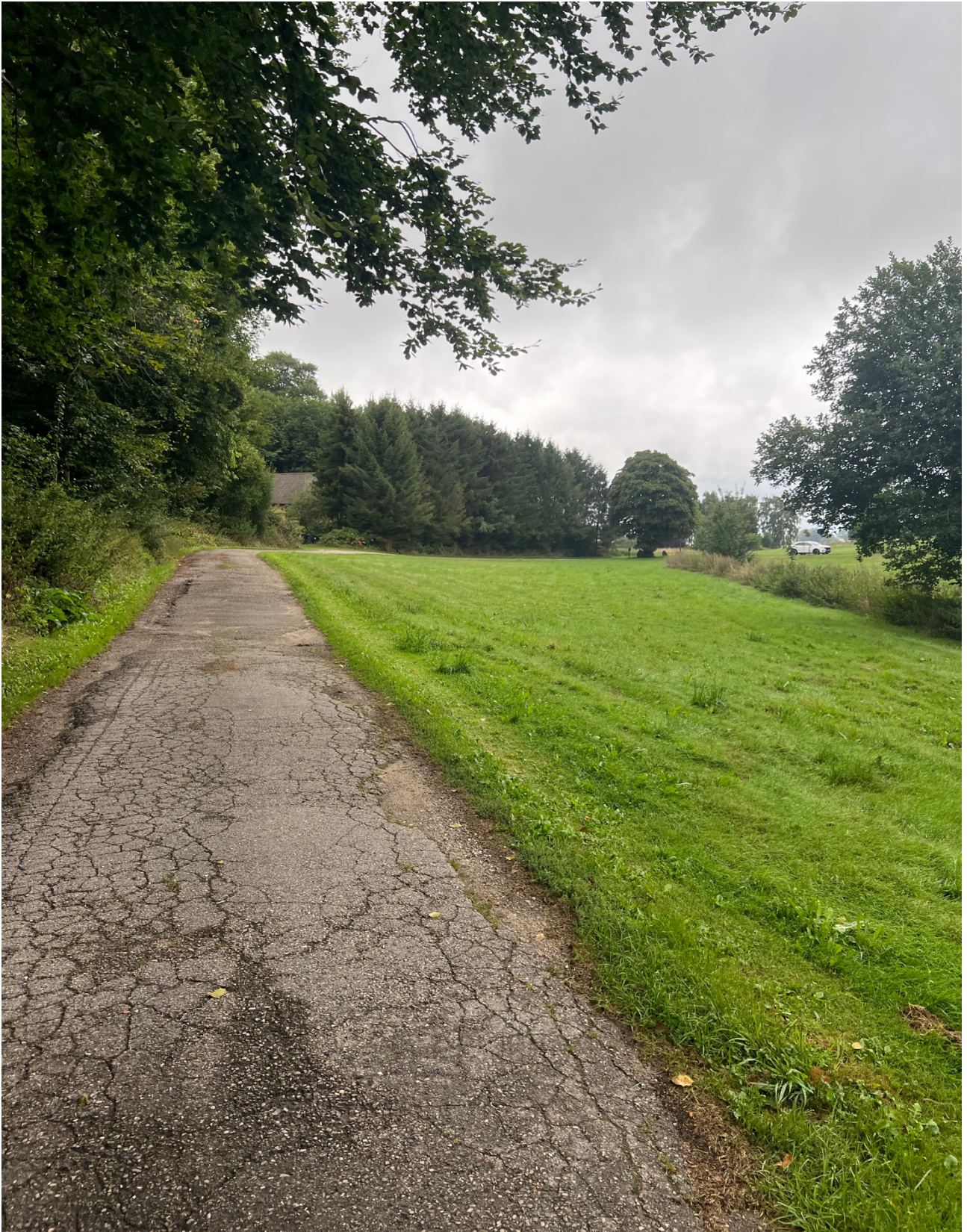
Skåret, hvor en gammel asfaltsti fører til et par ejendomme opført i Skåret og på kanten af Åsen.