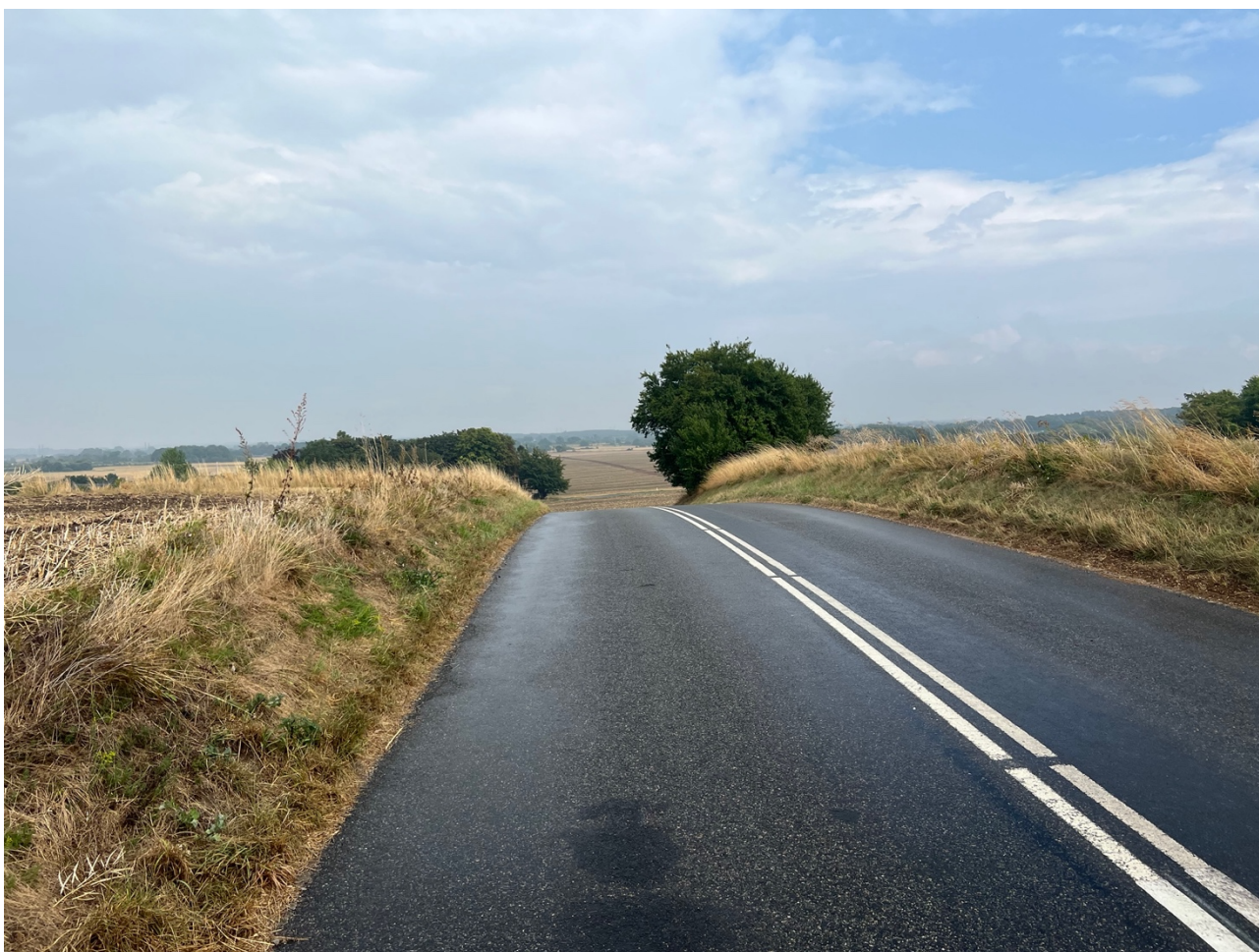
På bakketoppen mod Strøllille (udsigt mod Hillerød).

Danmarks Naturfredningsforening Hillerød ønsker hermed at indstille den del af Strø Bjerge, som her er beskrevet til en landskabsfredning.